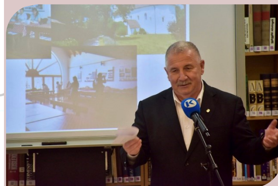
Szepes Tibor, Karcag Város polgármestere

Jó egészséget, sok szakmai és emberi örömet, és még sok olyan történetet kívánok, amelyet együtt írhatnak tovább! Kívánom, hogy ez a mai rendezvény legyen a jó beszélgetések és az együttlét örömeinek ideje.