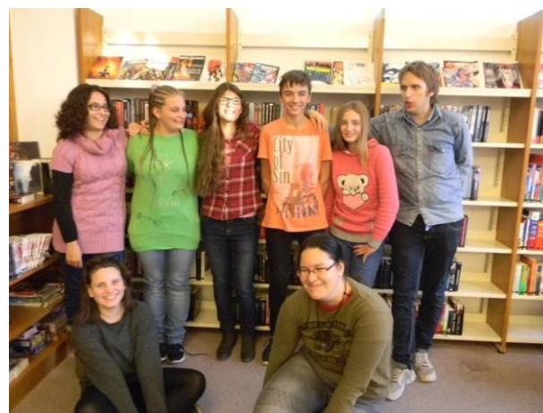
A szolnoki Krimi kör tagjai

A felmérés alapján majdnem képtelenség a kamaszokat becsalogatni a könyvtárba.